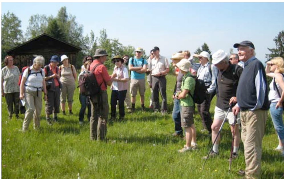
Exkursion auf der Bazora.